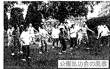
公園気功会の風景

1、会員増の取り組み…「神野福寿会だより」を毎月発行。その月に誕生日を迎える会員に誕生祝を届ける時の声かけ、近くの人や知人への呼びかけ、ふれあい会員に入会の勧め、休会となった友人に呼