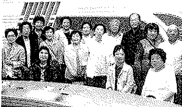
紺屋町長寿会 NHK佐賀放送局見学