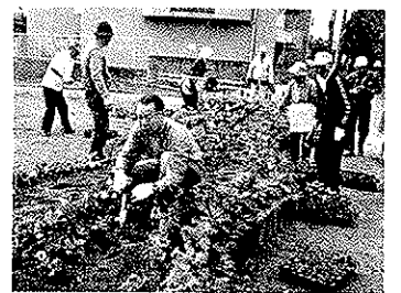
東部長寿会 旧・佐賀線跡地花壇植栽