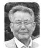
連長 雄 副会長 久徳 久徳 副会長

熊本市のホテルで、佐賀市老人クラブ連合会の各校区会長、理事など36人が出席した研修会が開催されました。