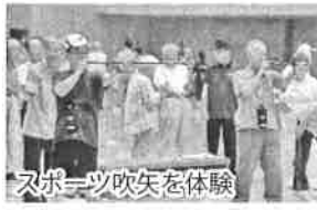
スポーツ吹矢を体験

8月3日(木)、諸富文化体育館ハートフルで今年度1回目のニュースポーツ体験講習会を開催。各校区老連からの4人、市老連会長・副会長および体育部長ら120人が参加しました。