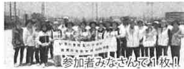
参加者みなさんで1枚!!

5月19日(金)市民運動広場において第4回女性グラウンドゴルフ大会が行われ、会場設営など、男性会員のサポートを受けての開催です。