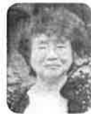
連子 区長 老連 池校 池会 今泉

3年前「100万人会員増強運動」が始まったとき、なんと遠い目標を掲げたものだと思つた。私たちのような小さなクラブにとつては、あまりに漠然とした目標で単なる数字に思えたものだった。