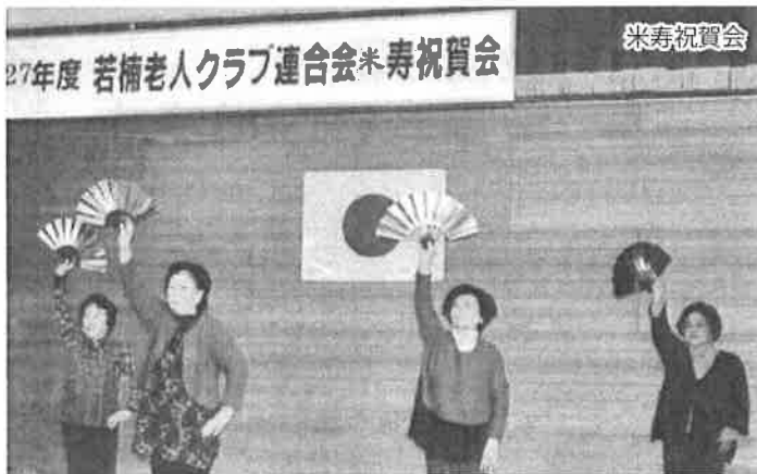
米寿祝賀会 27年度 若楠老人クラブ連合会

さて、若楠校区老連クラブの活動の基本は「単位老人クラブにある」と明記されているように、この先々まで存続し続けなくてはなりません。参考にといい、2月発行92号の「佐賀市老連だより」を讀ませていただきました。大変なエネルギーを感じる文章ばかりで、若楠老連のいち会員である私の文章がどこまで表現できるのか心配になってきました。