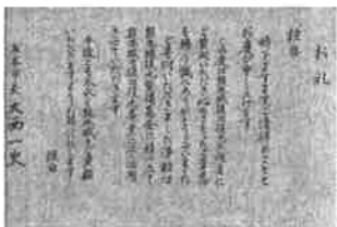
実際に送られたお礼の手紙