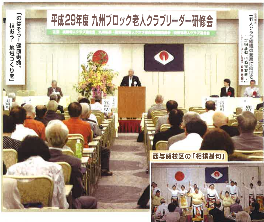
平成29年度九州ブロック老人クラブリーダー研修会

老ク信条 一、広く教養を高め、時代の流れに遅れないよう努めましょう。 二、過去の経験と体験を生かし、地域社会のためにつくしましょう。