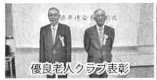
優良老人クラブ表彰