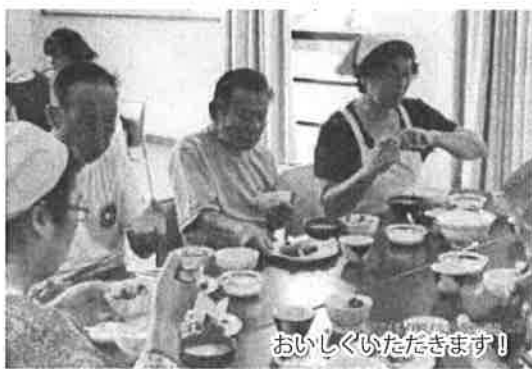
おいしくいただきます

料理教室では5つの調理台を使用して5班のグループを作り、食会の先生が各グループに1人ずつ付けて教えてくれます。私が2度びつくりしたのは、皆さんが包丁さばきなど、様々な料理