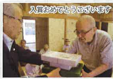
入賞おめでとうございます