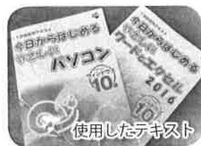
1月15日(日) 佐賀新聞「ひろば読者の声」欄掲載

この先、残された人生をばげずに元気で過ごすために、パソコンを楽しみ、ウォーキングにも励みたいと思っています。