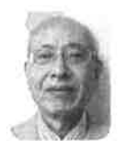
連長 宏 副会長 江越 江越 副会長