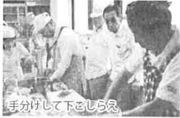
手分けして下をしらえ

その例会が終わわり、帰ろうとしていたときに、東与賀町の食育改善協議会（食会）の会長（町老人クラブ会員）さんから、町の老人クラブで男の料理教室をやってみませんかとの話がありました。そのときはあまり気にせず、普通の