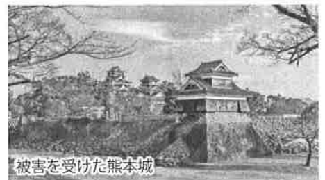
被害を受けた熊本城

鍋島校区老連に所属する鍋島長生会は年2回、1泊旅行と日帰り旅行を実施して会員相互の親睦を深めています。