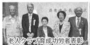
老人クラブ育成功労者表彰