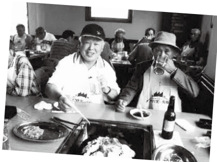
ウォーキングで汗を流した後の食事は最高!

に立ち、交通安全の見守りに当たります。 特に、各春夏秋冬の交通安全運動中は、朝7時から約1時間程度、クラブ内の主要交差点に立ち、交通安全活動に従事します。従事する時は、佐賀市が支給する、左胸に「さあ 大人の定番です」、背面に「子どもへまなざし運動」を印字した橙色