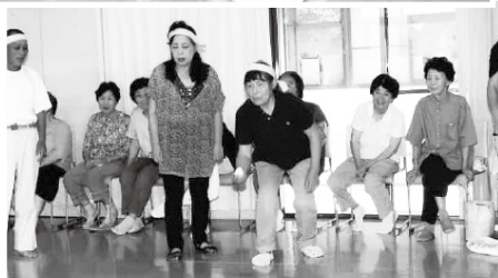
いご手玉大会の様子

私たちの蓮池校区老連は4つの単位クラブで組織され、会員数187名の小さな老人クラブ連合会であります。