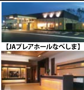
[JAプレアホールなべしま]