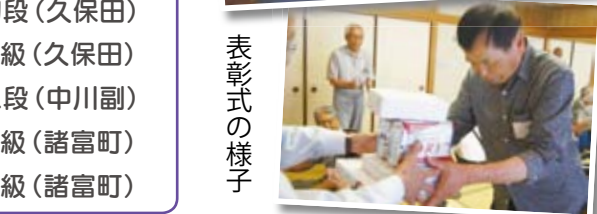
おめでとうございます!