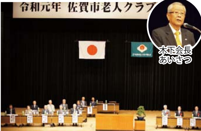
木下会長あいさつ

老ク信条 一、広く教養を高め、時代の流れに遅れないよう努めましょう。 二、過去の経験と体験を生かし、地域社会のためにつくしましょう。