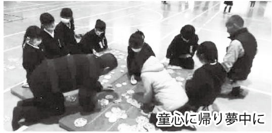
童心に帰り夢中に

昔の人の知恵と技に感心したりしていました。老人クラブ会員も当時を偲んで感慨深げでした。 一学年100名足らずの児童たちと老人クラブ会員20名ほどで交流をしています。その場だけではなく日常の生活の場にも交流が広がっています。 日頃の通学見守りの時などに「野菜づくりの名人おじいさんだ」とか「お手玉名人のおばあちゃん、おはよう」と言ってあいさつをしてくれます。