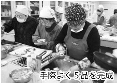
手際よく5品を完成