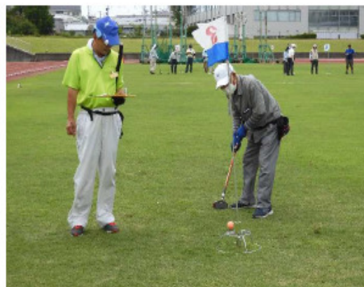
(老人クラブ連合会主催のグラウンドゴルフ大会)