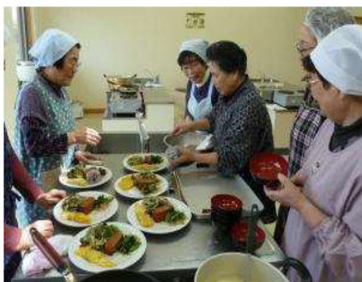
(老人クラブで講師を招いての料理教室)

佐賀市には236クラブ8,367人が老人クラブに加入して活動しています。生きがいと健康づくりの為、様々な活動を行っています。