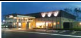
【JAプレアホールなべしま】